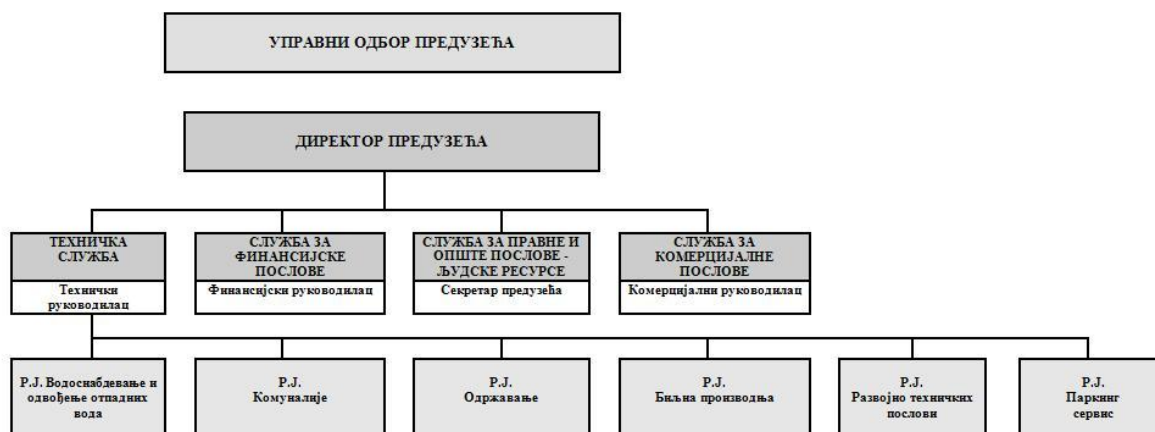
ОРГАНИЗАЦИОНА ШЕМА ЈКП "СТАНДАРД" КЊАЖЕВАЦ

Органи предузећа су: Надзорни одбор, Управни одбор и директор.